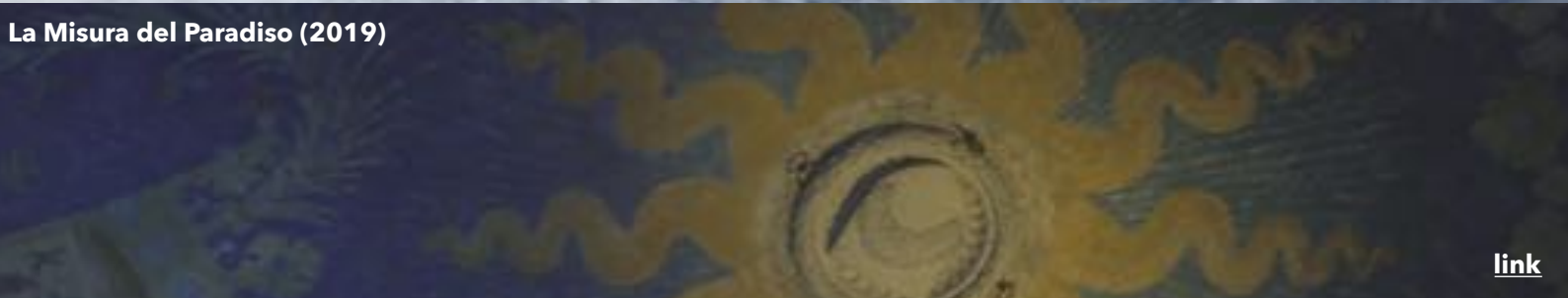
La Misura del Paradiso (2019)