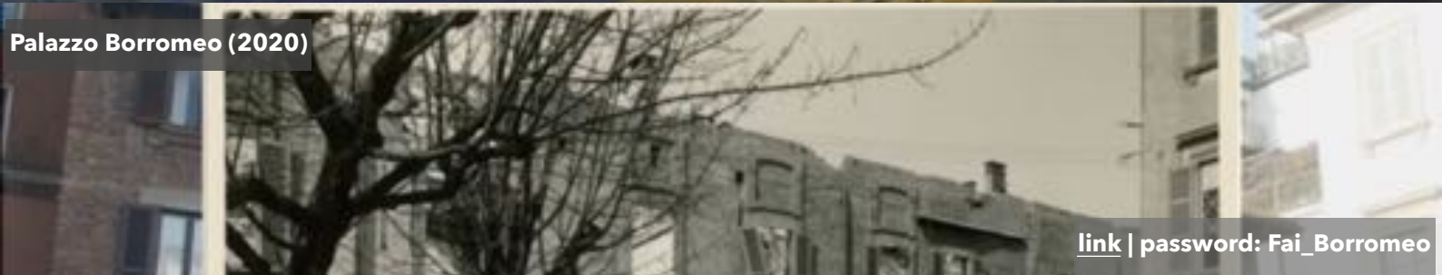
Palazzo Borromeo (2020)