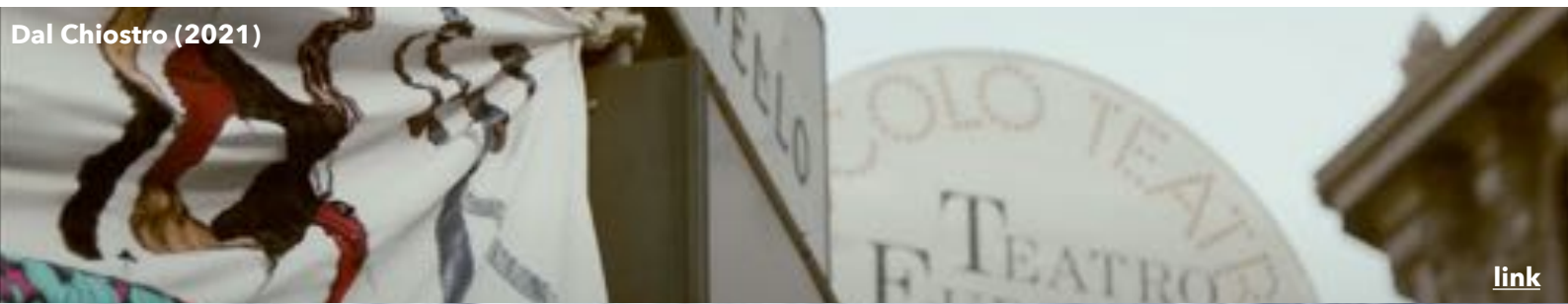
Dal Chiostro (2021)